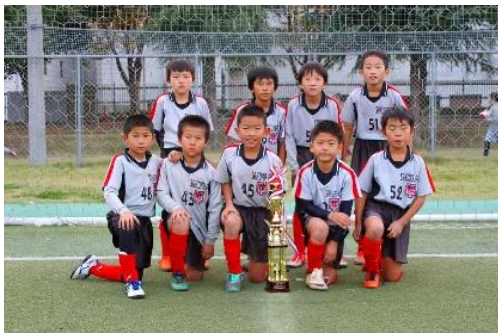
写真は昨年度優勝チーム：桜FC