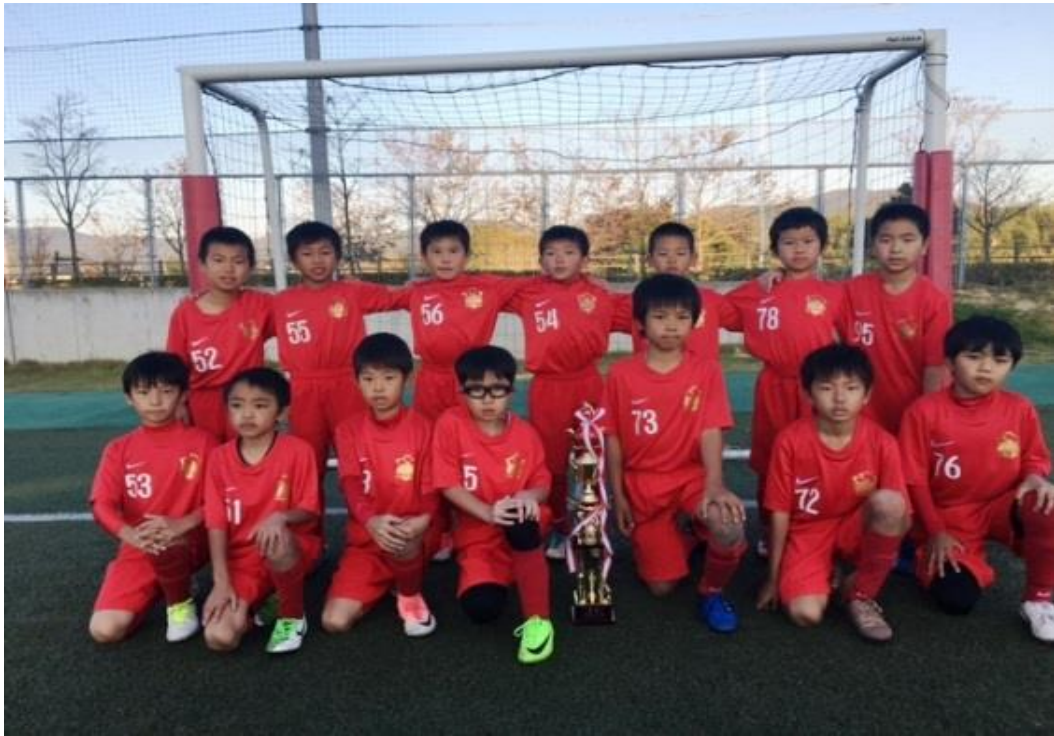
写真は昨年度優勝チーム：FC REGISTA TSUKUBA