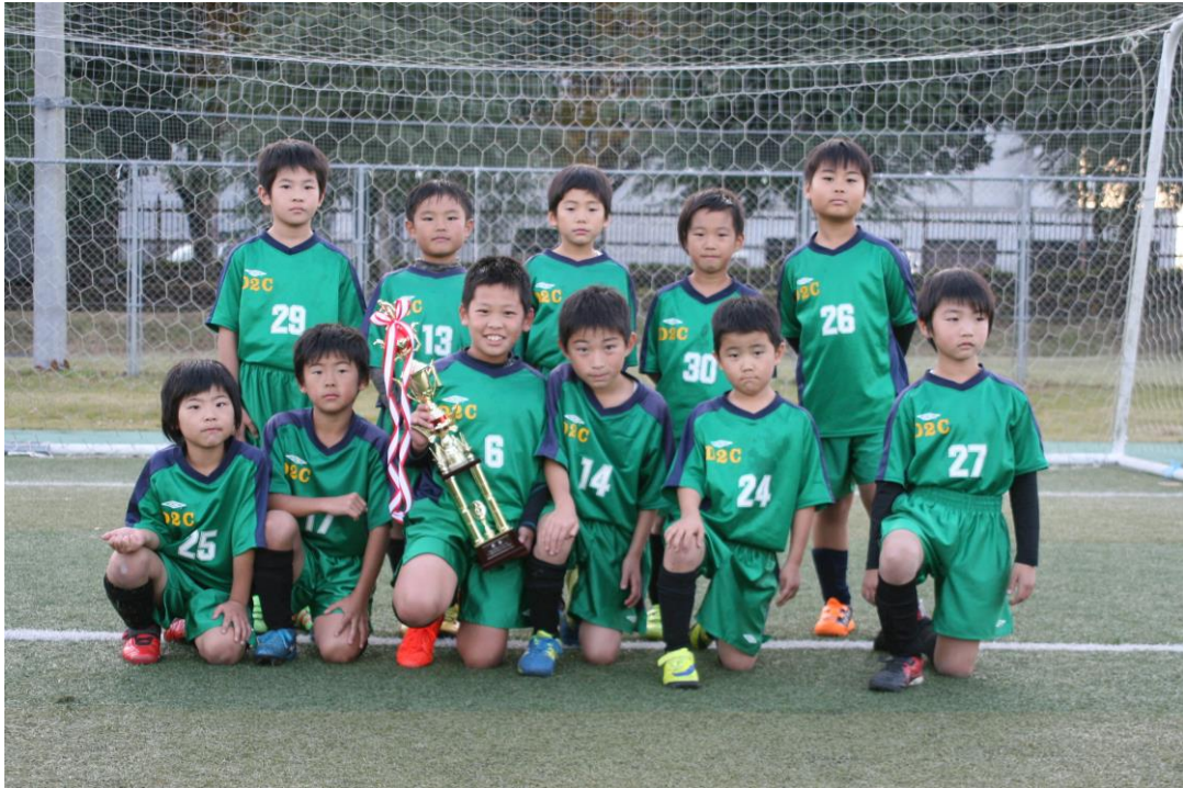
写真は昨年度優勝チーム：MAENO D2C SSS